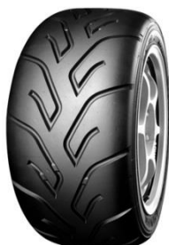
Pneumatique Yokohama A052 autorisé