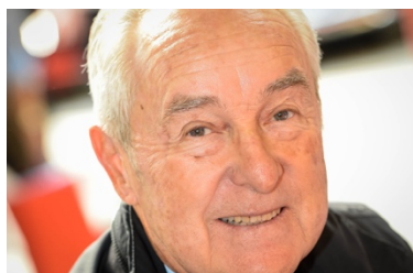
Gérard Larrousse

On note aussi la présence de pilotes illustres, à commencer par Gérard Larrousse, triple vainqueur du Tour de France Automobile (1969, 1971, 1974) et double vainqueur des 24 Heures du Mans (1973, 1974). L'ex-vedette de l'écurie Matra sera au volant d'une Porsche 911 2,5L ST (1972). Autre vainqueur des 24 Heures du Mans (2010, 2013, 2016), Romain Dumas participera à son premier Tour Auto Optic 2000 à bord d'une Porsche 356 B Carrera Abarth GTL. Les deux Français disputeront le rallye en catégorie régularité, à la différence du Belge Thierry Boutsen - trois victoires en Formule 1 (1989, 1990) - qui découvrira l'épreuve en compétition sur une Porsche 911 2,0L (1965).