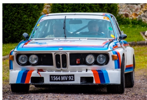
BMW 3.0 CSL (1972)

La première version de la liste des engagés laisse apparaître quelques automobiles d'exception, à l'image de l'Alfa Romeo Giulia TZ (1963), des deux BMW 3.0 CSL (1972), des trois Ferrari 250 GT Berlinetta (1960), de la Ford GT40 MkII (1969), de la Maserati 200 SI (1957), des deux Mercedes 300 SL (1955) ou encore de l'exotique Volkswagen Coccinelle 1303 S (1973). Rappelons que les modèles acceptés sont ceux inscrits à l'épreuve entre 1951 et 1973, à quelques exceptions près comme la Renault 5 Turbo Tour de Corse (1981), présente dans le cadre d'une opération caritative.