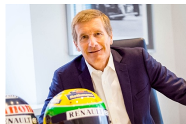
Thierry Boutsen