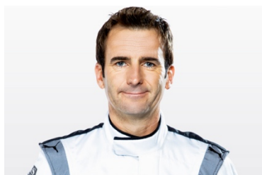
Romain Dumas